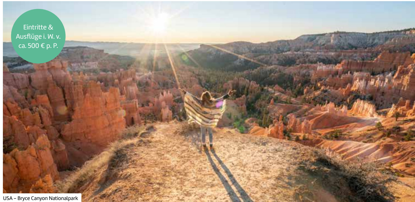
USA – Bryce Canyon Nationalpark