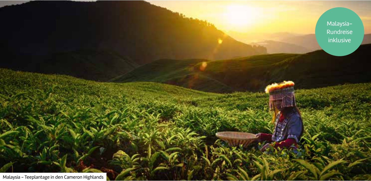
Malaysia – Teeplantage in den Cameron Highlands