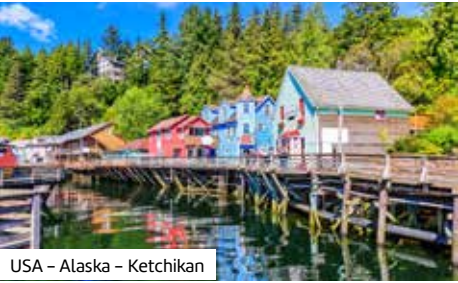
USA – Alaska – Ketchikan

Heute geht es entlang des St.-Lorenz-Stroms nach Montréal. Stadtrundfahrt durch Alt- und Neustadt mit Blick auf den Mont Royal. 8. Tag – Montréal – 1.000 Islands Nationalpark – Toronto (ca. 550 km). Sie fahren in die Region der 1.000 Inseln. Optional: Bootsfahrt durch die Inselwelt (ca. 1 Std., ca. 39 CAD ). Rückfahrt nach Toronto. 9. Tag – Toronto – Calgary. Transfer zum Flughafen und Flug nach Calgary. Empfang durch die Reiseleitung und Fahrt zum Hotel. 10. Tag – Calgary – Banff Nationalpark – Canmore (ca. 130 km). Kurze Stadtrundfahrt in Calgary. Weiter geht es in die Rocky Mountains: Besuch des Banff Nationalparks mit Lake Louise und Johnston Canyon. Optional: Helikopterflug über die Rockies (ca. 25 Min., ca. 329 CAD ). 11. Tag – Canmore. Der Tag steht Ihnen zur freien Verfügung. Optional: Tagesausflug in den Jasper Nationalpark (ca. 8 Std., ca. 119 CAD ). 12. Tag – Canmore – Glacier Nationalpark – Mount Revelstoke Nationalpark – Vernon (ca. 455 km). Fahrt durch die Nationalparks Yoho, Glacier und Mount Revelstoke mit Stopps an Aussichtspunkten. Eindrücke von Gletschern und alpiner Vegetation. 13. Tag – Vernon – Vancouver (ca. 440 km). Fahrt nach Vancouver. Stadtrundfahrt durch die Küstenmetropole mit Besuch des Stanley Parks und Downtown. 14.–15. Tag – Vancouver. Zeit zur freien Verfügung. Optional: Tagesausflug nach Vancouver Island mit Fähre, Besuch von Victoria und Freizeit vor Ort