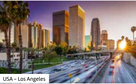
USA – Los Angeles

3-Sterne-Hotel Ibis Styles Sydney Central Das Hotel liegt in der Wentworth Avenue zwischen dem weitläufigen Hyde Park und dem Belmore Park. Neben dem Stadtzentrum, Sydney CBD, bietet es eine hervorragende Ausgangsbasis, um die interessanten Stadtteile Surry Hills, Darlinghurst und Paddington mit ihren Cafés, Restaurants, Bars und Einkaufsmöglichkeiten zu erkunden. Bis zum Flughafen Sydney sind es ca. 7 km (Fahrzeit: ca. 20 Minuten). Das weltberühmte Opernhaus finden Sie in ca. 2.5 km Entfernung, das Sydney Aquarium sowie den Wildlife Sydney Zoo in ca. 2 km. Ebenfalls in der Nähe befinden sich die Central Station (ca. 800 m) sowie die Bucht Darling Harbour (ca. 1.5 km). Das Hotel verfügt über 24-Stunden-Rezeption, Lift, WLAN, Safe und Fitnessraum. Die Doppelzimmer (ca. 20 m²) sind mit Bad oder Dusche/WC, Föhn, Klimaanlage (individuell regelbar), Safe, Sitzecke, Bügeleisen, Bügelbrett, Kühlschrank, Kaffee-/Teezubereiter, Wasserkocher, Telefon, WLAN/ WiFi, Kabel-TV und Radio ausgestattet. 3-Sterne-Hotel Fairfield Inn & Suites Los Angeles Freuen Sie sich auf einen angenehmen Aufenthalt in Los Angeles! Nur ca. 3 km vom Los Angeles International Airport entfernt, bietet das Fairfield Inn & Suites by Marriott Los Angeles perfekten Komfort mit modern ausgestatteten Zimmern. Es ist ein idealer Ausgangspunkt für Erkundungen in Los Angeles – mit schnellen Verbindungen zu Stränden, Hol-