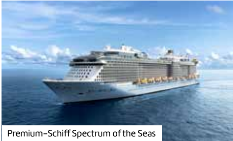
Premium-Schiff Spectrum of the Seas