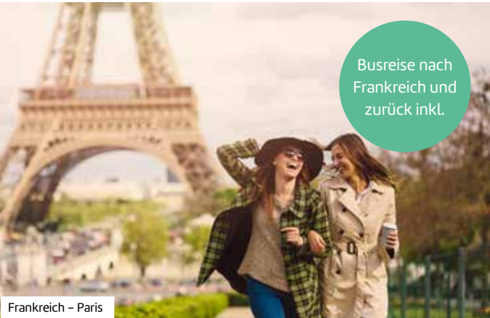
Frankreich – Paris

Buchen Sie hier diese Reise direkt: berge-meer.de/K82116