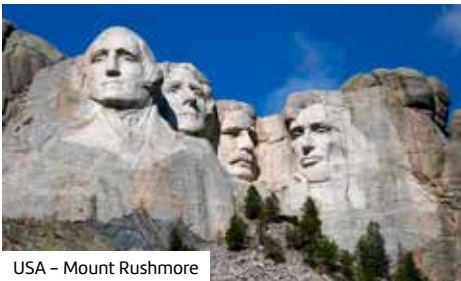
USA – Mount Rushmore

10. Tag – Bryce Canyon Nationalpark (Utah/USA) – Monument Valley – Kayenta (Arizona/USA) (ca. 480 km). Heute geht es ins Reservat des indigenen Volkes der Navajo und in das Monument Valley. Das Tal kann unter Navajo-Führung erkundet (vor Ort buchbar, ca. 86 USD p. P., Dauer ca. 1.5 Std.) oder vom Besucherzentrum aus