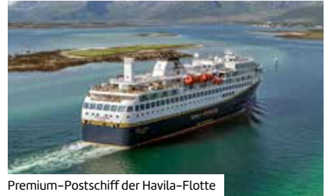
Premium-Postschiff der Havila-Flotte