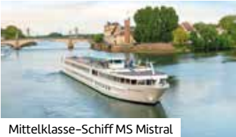
Mittelklasse-Schiff MS Mistral

Busreise nach Frankreich und zurück inkl.