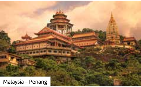
Malaysia – Penang

12.–28. Tag – Kreuzfahrt wie beschrieben. Änderungen vorbehalten.