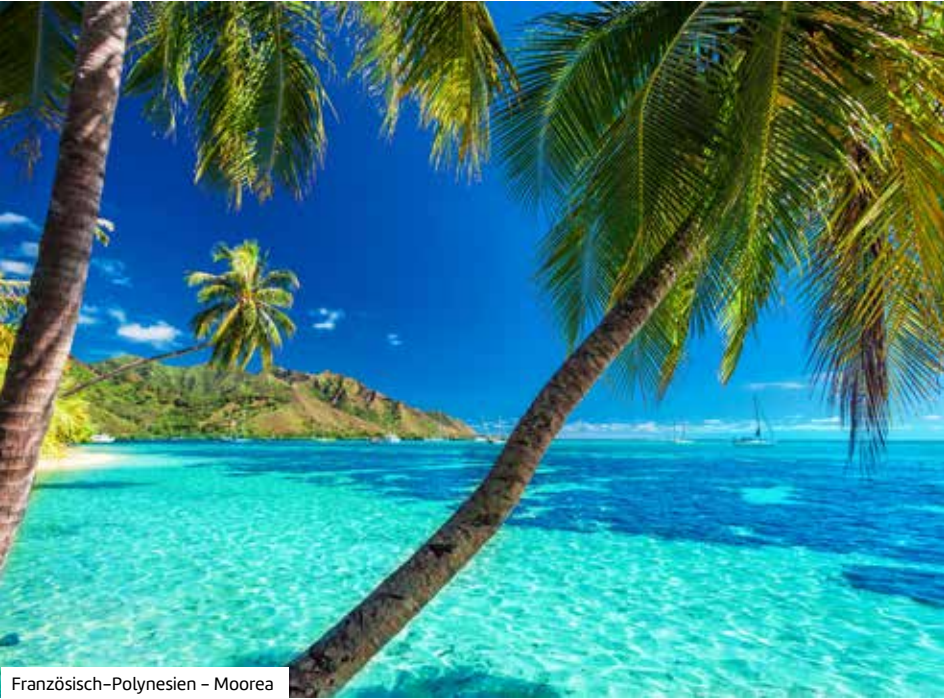
Französisch-Polynesien – Moorea

Premium-Plus-Schiff Discovery Princess Willkommen auf Ihrem Kreuzfahrtschiff! Die Discovery Princess, welche 2022 in Dienst gestellt wurde, bietet auf einer Länge von 330 m und 15 Decks Platz für bis zu 3.660 Passagiere. In zwölf Restaurants genießen Sie eine breite Auswahl internationaler Köstlichkeiten. Für Unterhaltung und Entspannung stehen fünf Pools, darunter der traumhafte Wake View-Pool, sowie luxuriöse Bereiche wie The Sanctuary zur Verfügung. Sportbegeisterte können sich im Fitness-Center, auf der Joggingbahn oder beim Basketball auspowern, während das Freilichtkino, das Theater und das Casino für abwechslungsreiche Abende sorgen. Die jüngeren Gäste kommen im Kids Club und der Teenslounge auf ihre Kosten. Ob stilvolle Bars wie Bellini's oder mitreißende Shows in der Vista Show Lounge – an Bord der Discovery Princess erwartet Sie eine perfekte Mischung aus Eleganz, Genuss, vielfältigen Freizeitmöglichkeiten und erstklassiger Unterhaltung.