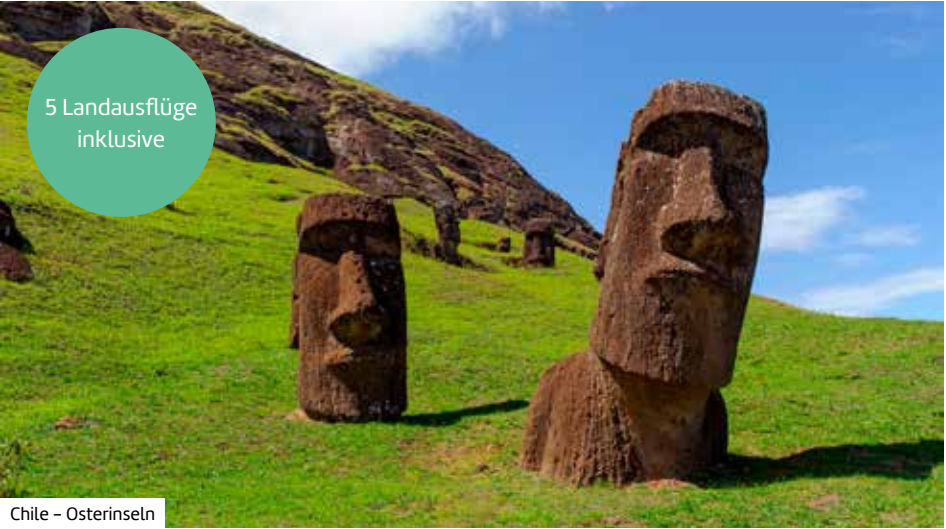
Chile – Osterinseln