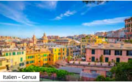
Italien – Genua