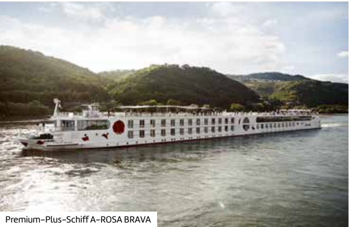
Premium-Plus-Schiff A-ROSA BRAVA

Buchen Sie hier diese Reise direkt: berge-meer.de/K83292