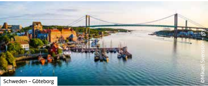
Schweden – Göteborg

Buchen Sie hier diese Reise direkt: berge-meer.de/K8W155