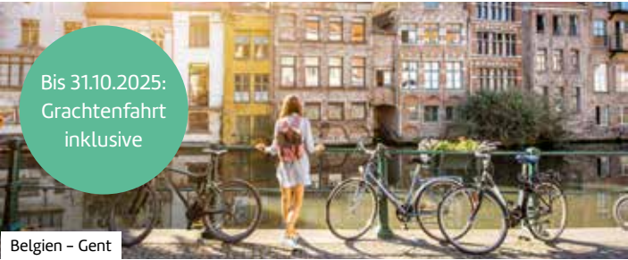
Belgien – Gent

Buchen Sie hier diese Reise direkt: berge-meer.de/ K84114