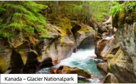
Kanada – Glacier Nationalpark