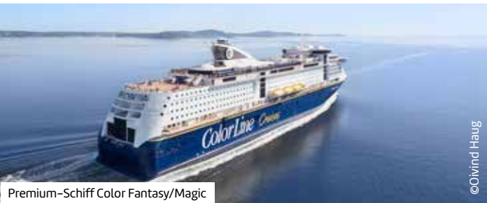
Premium-Schiff Color Fantasy/Magic

Buchen Sie hier diese Reise direkt: berge-meer.de/K8W154