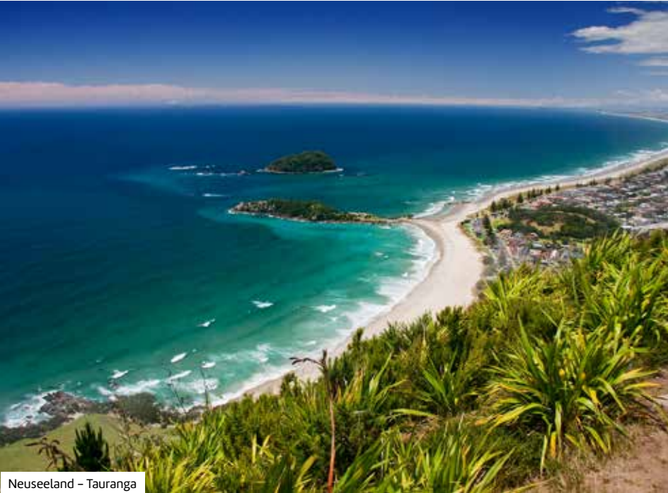
Neuseeland – Tauranga