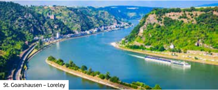
St. Goarshausen – Loreley