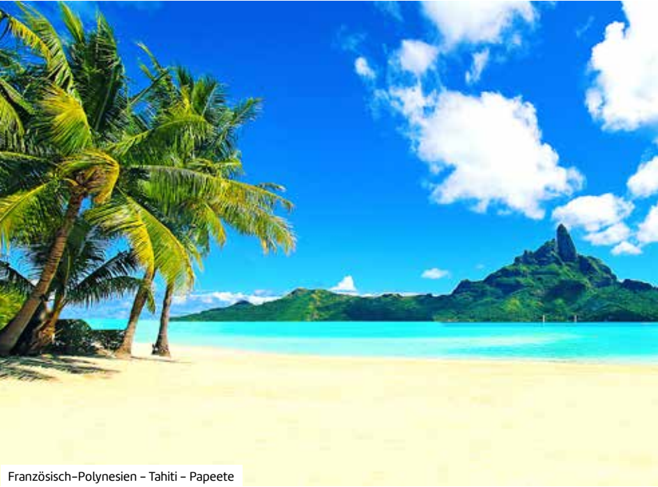
Französisch-Polynesien – Tahiti – Papeete

Änderungen vorbehalten. *Tenderhafen, Ausbooten wetterabhängig. **Ausschiffung nicht erlaubt.