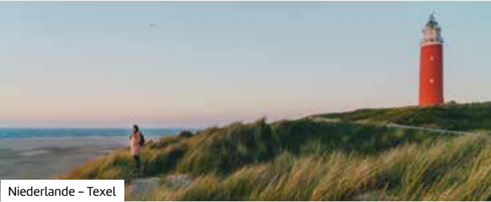
Niederlande – Texel

Buchen Sie hier diese Reise direkt: berge-meer.de/ K84119