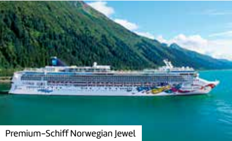
Premium-Schiff Norwegian Jewel

Kommen Sie mit auf eine Reise durch Kanadas Osten und entdecken Sie im Anschluss per Schiff die Highlights Neuenglands.