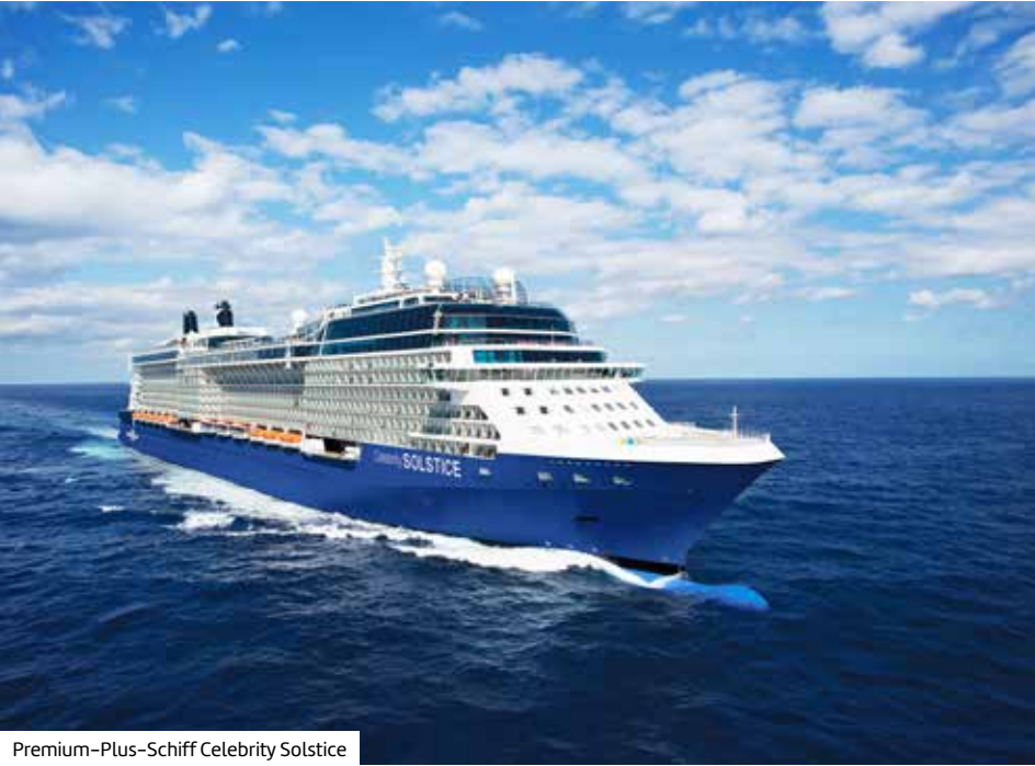
Premium-Plus-Schiff Celebrity Solstice