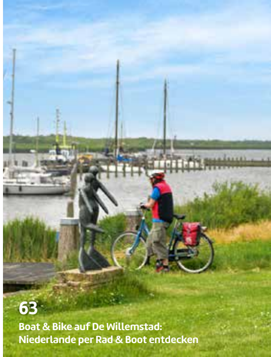
63 Boat & Bike auf De Willemstad: Niederlande per Rad & Boot entdecken