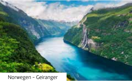
Norwegen – Geiranger

exklusive Samsara-Restaurant und das spektakuläre “Tavola Teppanyaki” mit Showküche, bietet sie kulinarische Vielfalt rund um die Uhr. Der beeindruckende Samsara SPA erstreckt sich über vier Ebenen und rund 6.200 m² – eines der größten Wellnessareale auf See, das zu begeistern weiß. Entertainment wird hier großgeschrieben: Ein stilvolles Theater mit Shows, 4D-Kino, Casino, Country-Rock-Club, Videospielwelten, Grand-Prix-Simulator und ein imposanter Laser-Maze gehören dazu. Das Pooldeck mit Glasdach und Kinoleinwand macht Filmnächte zum Erlebnis unter freiem Himmel. Mit einer Länge von ca. 306 m, 37 m Breite, 14 Decks, 1.862 Kabinen für bis zu 4.947 Passagiere, 1.253 Crewmitgliedern, einer 500 m langen Außenpromenade sowie dem modernen Landstromanschluss beeindruckt das Schiff auch technisch. Die Kombination aus kulinarischen Höhepunkten, Wellness, Sport, Unterhaltung und Stil macht die Costa Diadema zu einem unvergleichlichen Kreuzfahrterlebnis. An Bord herrscht eine internationale Atmosphäre, mit Gästen und Besatzung aus der ganzen Welt. Zu Ihrer sprachlichen Unterstützung finden Sie an Bord aller Costa-Schiffe eine deutschsprachige Hostess (je nach Verfügbarkeit), die Ihnen mit Rat und Tat zur Seite steht. Neben Einschiffungs- und Ausschiffsveranstaltungen und informativen Vorträgen über das Schiff und/oder die Route finden täglich Sprechstunden statt, in denen Sie Ihre Anliegen und Fragen klären können. Ebenfalls