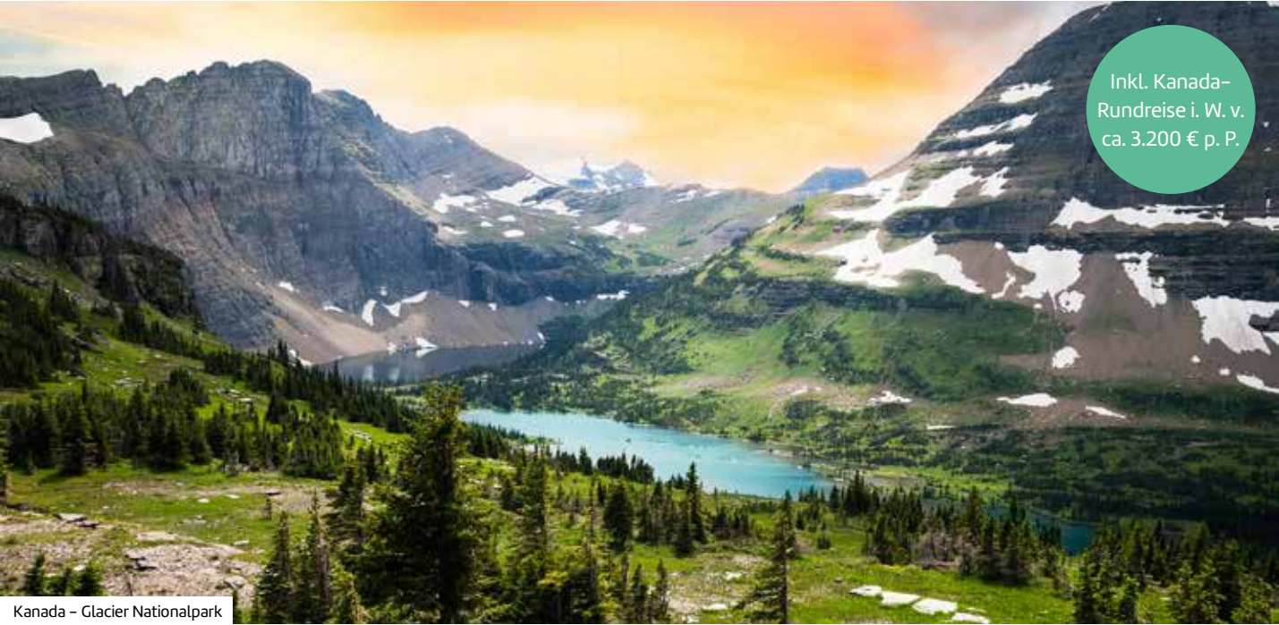
Kanada – Glacier Nationalpark

Inkl. Kanada– Rundreise i. W. v. ca. 3.200 € p. P.