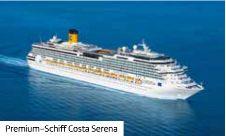
Premium-Schiff Costa Serena

Zuerst verbringen Sie zwei Nächte in Hongkong, dann geht es zu Traumzielen wie Bali, Sydney und den Osterinseln – bis zur Ankunft in Chile.