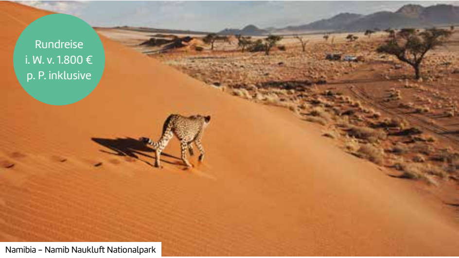
Namibia – Namib Naukluft Nationalpark