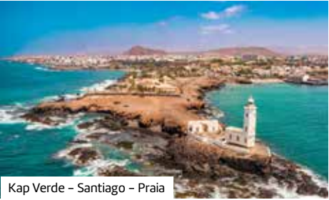
Kap Verde – Santiago – Praia