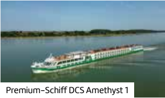
Premium-Schiff DCS Amethyst 1

Buchen Sie hier diese Reise direkt: berge-meer.de/ K83239