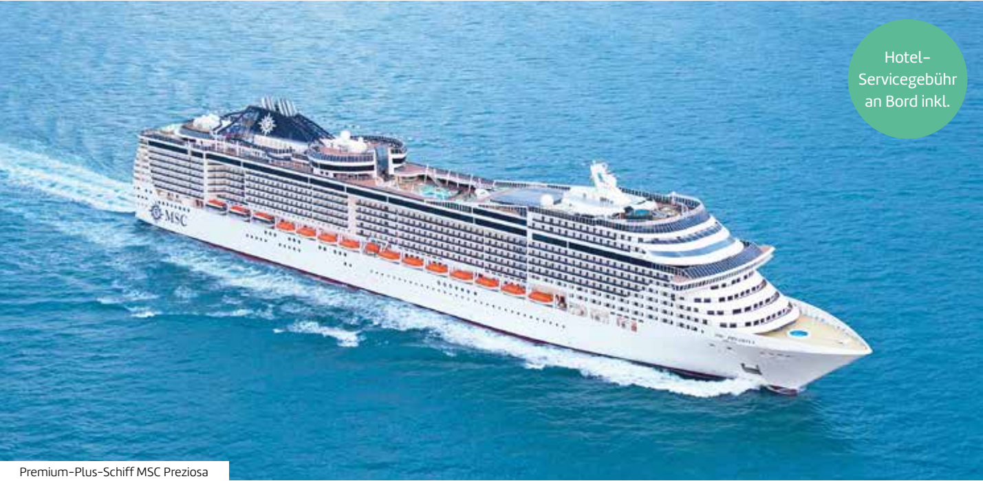
Premium-Plus-Schiff MSC Preziosa

Von Hamburg geht es über die idyllische Rosenstadt Molde bis nach Tromsø, Longyearbyen auf Spitzbergen und zum legendären Nordkap. Malerische Fjorde, majestätische Gletscher, charmante Städte und unvergessliche Naturerlebnisse nördlich des Polarkreises erwarten Sie.