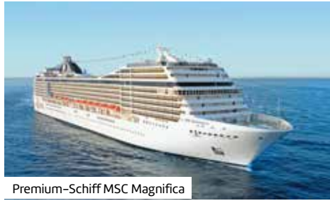
Premium-Schiff MSC Magnifica