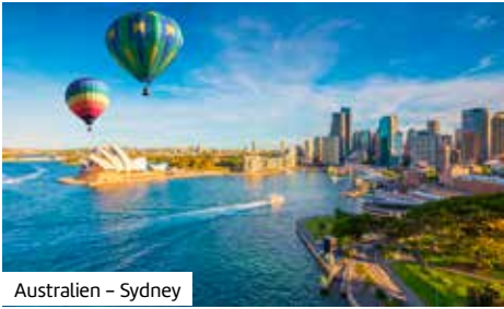
Australien – Sydney

Sydney erwartet Sie mit seiner eindrucksvollen Oper und der Harbour Bridge. Dann heißt es: Leinen los! Entdecken Sie mit der Discovery Princess charmante Orte wie Auckland und Christchurch. Zum Schluss verbringen Sie vier Nächte in Sydney sowie drei Nächte in Melbourne.