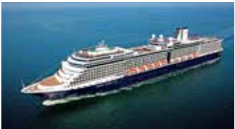
Premium-Plus-Schiff Nieuw Amsterdam