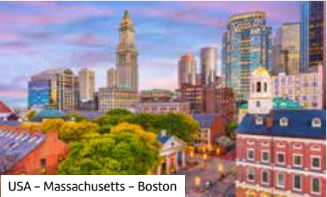
USA – Massachusetts – Boston