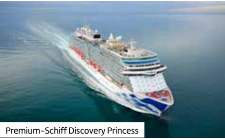
Premium-Schiff Discovery Princess

Kabinenkategorien Innenkabinen. Die komfortablen Kabinen (ca. 15 m²) bieten ein Queensize-Doppelbett, Bad mit Dusche/WC, Kleiderschrank, Minikühlschrank und Sat.-TV. Balkonkabinen. Diese geräumigen Kabinen (ca. 25 m²) bieten bei gleicher Ausstattung wie die Innenkabinen zusätzlich eine Schlafcouch, einen Schreibtisch sowie einen Balkon. Schiffs- und Freizeiteinrichtungen teilweise gegen Gebühr. Internationales Publikum. Bordsprache: Englisch. Die Kabinenzuteilung obliegt der Reederei.