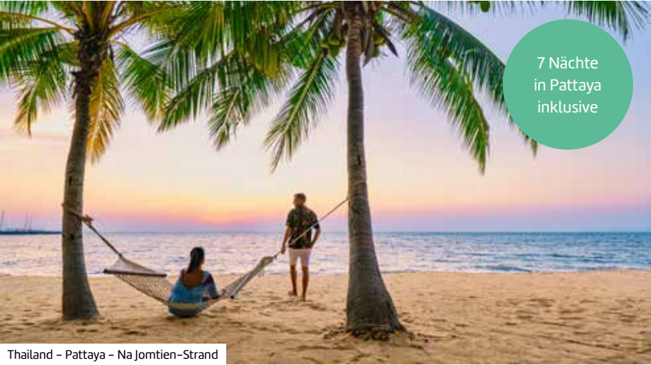
Thailand – Pattaya – Na Jomtien-Strand

Reisezeitraum Mai bis September 2026 Reisedauer: 13 Nächte Aktuelle Termine & Preise online