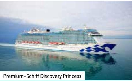
Premium-Schiff Discovery Princess