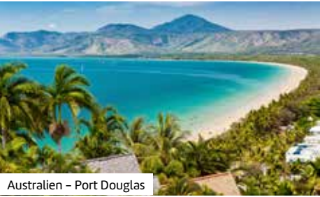
Australien – Port Douglas

gung – der 0,5 Hektar große Lawn Club auf Deck 15 lädt zum Lawn-Bowling, Open-Air-Jazz, Picknick oder entspanntem Sonnenbaden unter freiem Himmel ein, sogar mit einem großen Movie-Screen für Outdoor-Filmabende. Der moderne AquaSPA-Bereich des Schiffes bietet alle Annehmlichkeiten eines exklusiven Wellnesshotels auf See, ergänzt durch ein vielfältiges Angebot an Beauty- und Wellnessanwendungen. Das faszinierende zweigeschossige Hauptrestaurant ist mit raumhohen Fenstern ausgestattet, durch die Sie einen herrlichen Meerblick genießen. Im zweistöckigen Theater erwarten Sie brandneue Shows und künstlerische Darbietungen der Spitzenklasse. Es steht ein breites Angebot an Geschäften, Casino, Live-Musik, Bars und Cafés zur Verfügung. Bereits bei der Einführung der Solstice-Klasse wurde viel Wert auf Umweltschutz und Energie-Effizienz gelegt: Die Schiffe dieser Klasse verbrauchen dank innovativer Technik der Meyer-Werft rund 30 % weniger Energie als vergleichbare Kreuzfahrtschiffe. Die Innenkabinen (ca. 16 m²) bieten Dusche/WC, Föhn, TV, Telefon, Minibar (gegen Gebühr), Safe, Bademäntel, Frisierkommode und Sitzzecke. Die Außenkabinen (ca. 16 m²) verfügen zusätzlich über ein Panoramafenster (evtl. mit Sichtbehinderung). Die Balkonkabinen (ca. 18 m²) bieten zusätzlich einen privaten Balkon (ca. 5 m², evtl. mit Sichtbehinderung) mit raumhohen Glastüren. Schiffs- und Freizeiteinrichtungen teilweise gegen Gebühr. Bordsprache: Englisch. Die Kabinenzuteilung obliegt der Reederei.