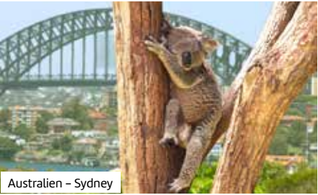
Australien – Sydney