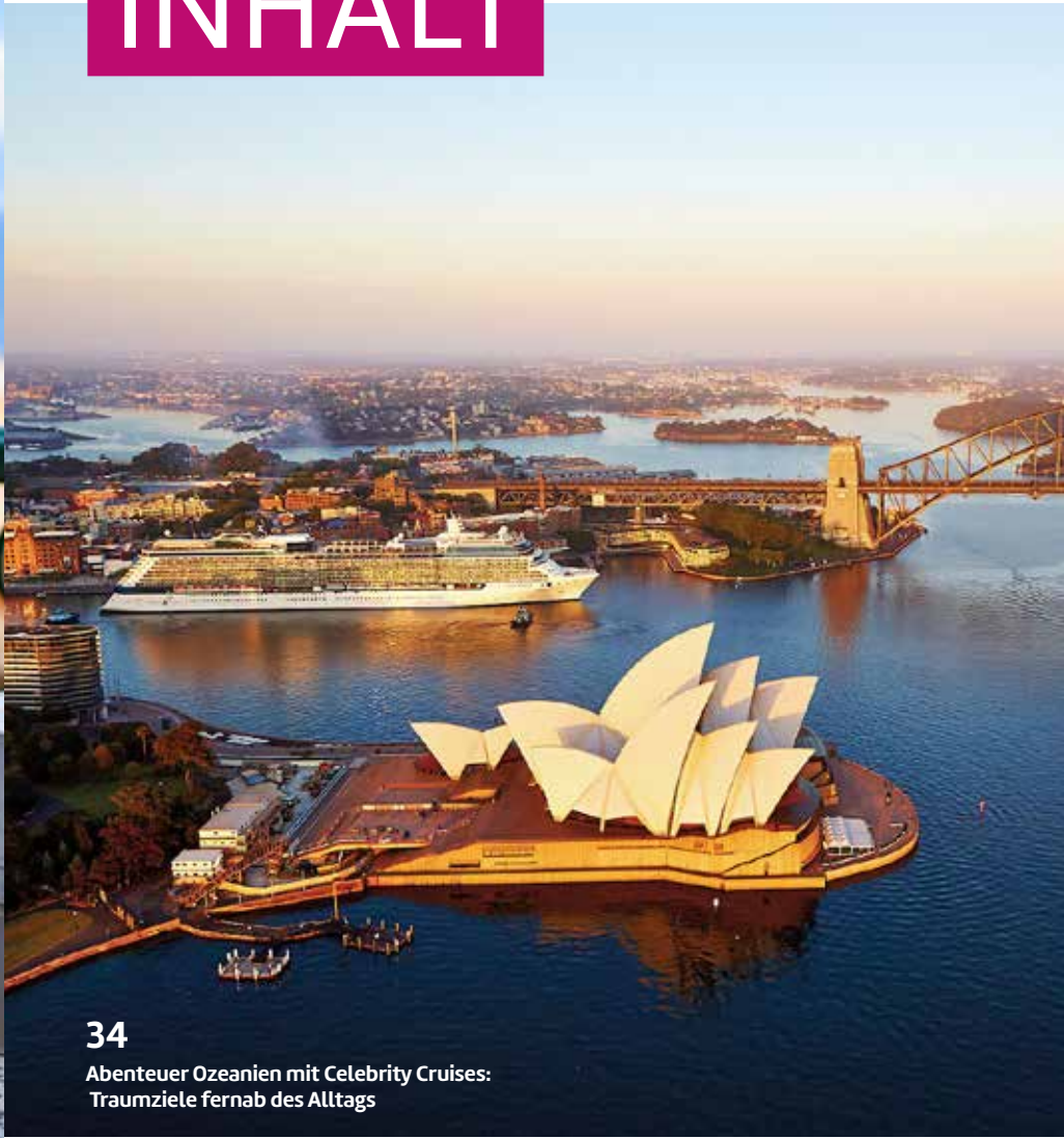
34 Abenteuer Ozeanien mit Celebrity Cruises: Traumziele fernab des Alltags