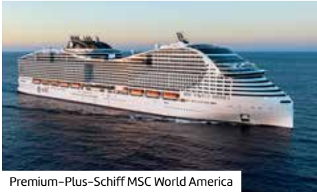
Premium-Plus-Schiff MSC World America

Erst Floridas Sonne, Städte & Natur erleben – dann mit MSC World America zu Karibikinseln, Ocean Cay und pulsierenden Hafenorten.