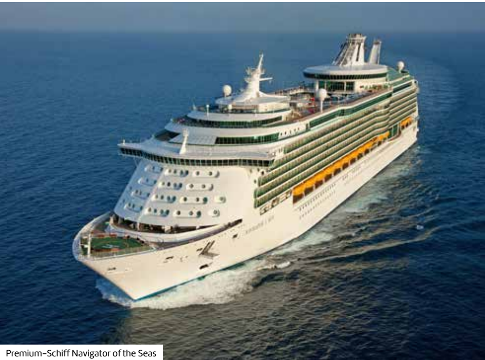
Premium-Schiff Navigator of the Seas

17.–25. Tag – Kreuzfahrt wie beschrieben. Änderungen vorbehalten. Die im Reiseverlauf dargestellten Preise der vor Ort buchbaren Ausflüge und können evtl. abweichen.