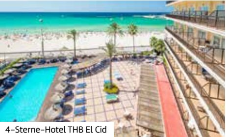
4-Sterne-Hotel THB El Cid