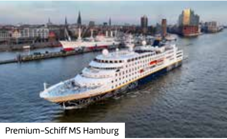
Premium-Schiff MS Hamburg

Starten Sie mit einer Namibia-Rundreise, bevor Sie per Schiff Afrikas Küsten, die Inselwelten des Atlantiks und Europas Landschaften entdecken.