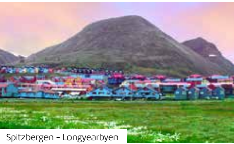
Spitzbergen – Longyearbyen

Theater, viele Geschäfte, Casino, „Virtual World“, Joggingpfad und das große Pooldeck – nicht zu vergessen das große MSC Aurea SPA! Auf dem „Top 18 Sonnendeck“, welches nur für Erwachsene zugänglich ist, können Sie in Ruhe entspannen. Der Doremi Castle Aqua Park und die 120 m lange Wasserrutsche, welche sich über drei Decks zieht, sorgen für großen Spaß bei Jung und Alt. Lassen Sie sich von der Sonne verwöhnen und nutzen Sie den speziellen SPA-Service mit Bar-Menüs. Genießen Sie den Aufenthalt an Bord und lassen Sie Ihren Blick in die weite Ferne schweifen. Auch der Gästebereich lässt keine Wünsche offen. Die Innenkabinen A/B (ca. 13 m²) verfügen über ein Doppelbett, Sat.-TV, Telefon, individuell regulierbare Klimaanlage sowie Bad mit Dusche, WC und Föhn. Minibar, Safe und WLAN in der Kabine sind gegen Gebühr verfügbar. Die Kategorie B liegt in einer besseren Lage auf dem Schiff. Die Außenkabinen A (ca. 12 m²) bieten zusätzlich ein Fenster oder Bullauge (nicht zu öffnen). Auch hier sind Minibar, Safe und WLAN in der Kabine gegen Gebühr verfügbar. Die Balkonkabinen A (ca. 18 m² inkl. ca. 3 m² Balkon) verfügen zusätzlich über raumhohe Fenster zum privaten Balkon mit Sitzgelegenheiten (teilweise nur französischer Balkon ohne Sitzgelegenheit, ggf. mit Sichtbehinderung). Die Balkonkabinen B (ca. 14 m² inkl. ca. 3 m² Balkon) bieten ebenfalls einen privaten Balkon mit Sitzgelegenheiten und unterscheiden sich nur durch die Größe und Lage. Die Balkonkabinen C (ca. 18 m² inkl. ca. 4 m²