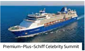
Premium-Plus-Schiff Celebrity Summit