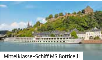
Mittelklasse-Schiff MS Botticelli

Busreise nach Frankreich und zurück inkl.