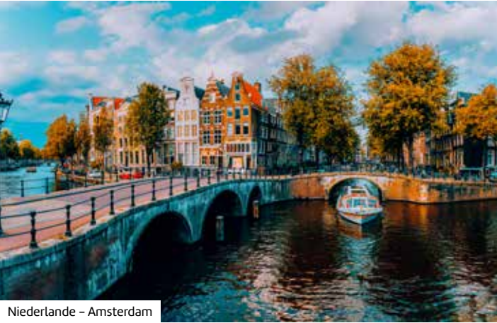
Niederlande – Amsterdam