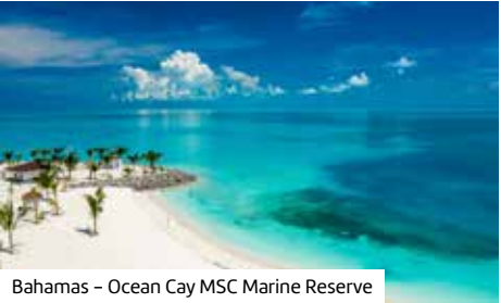
Bahamas – Ocean Cay MSC Marine Reserve