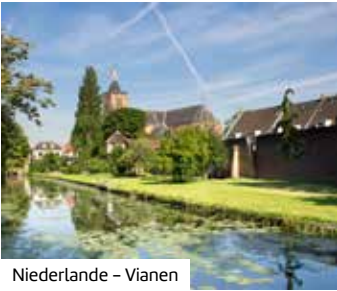
Niederlande – Vianen