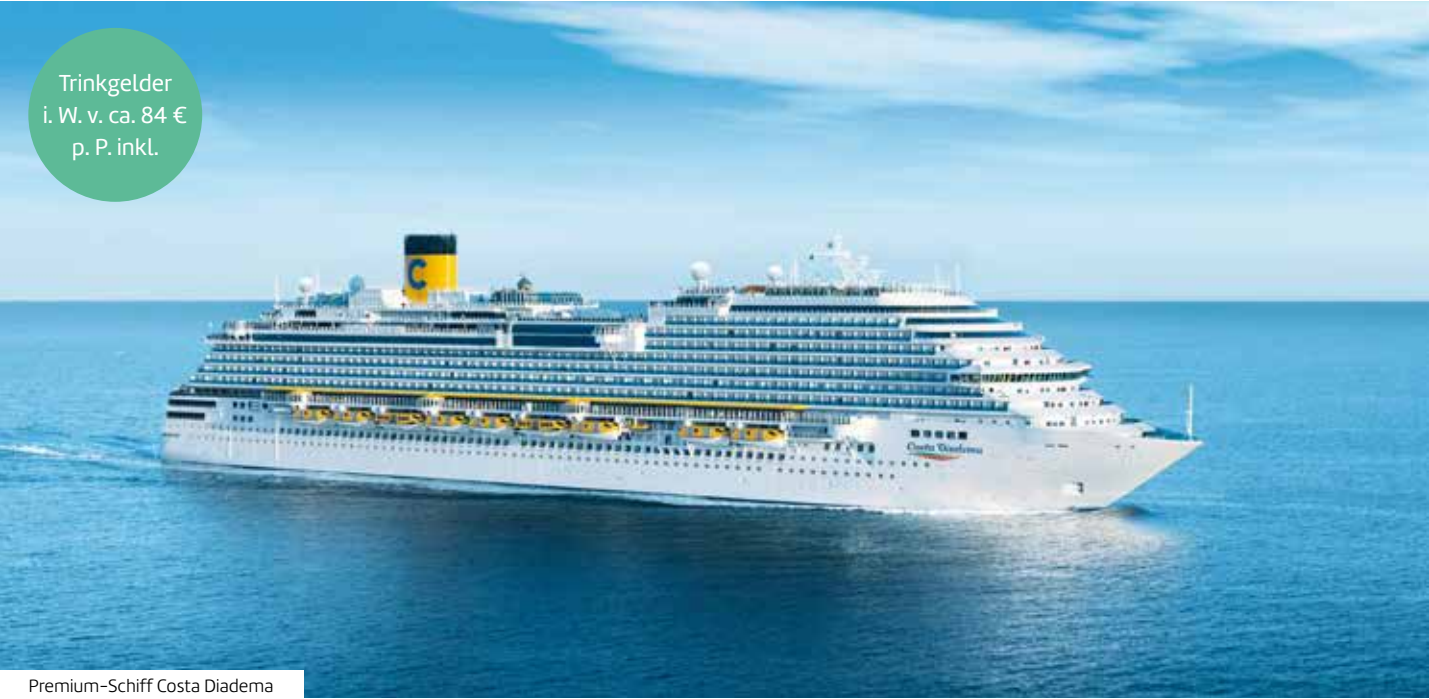
Premium-Schiff Costa Diadema

In Kiel gehen Sie an Bord der Costa Diadema, die Sie auf eine Reise entlang der norwegischen Fjorde entführt. Neben der traumhaft schönen Bilderbuchnatur erwarten Sie moderne und facettenreiche Städte, wie das dänische Kopenhagen und das norwegische Stavanger.