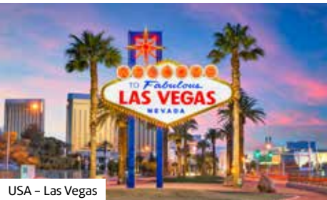
USA – Las Vegas