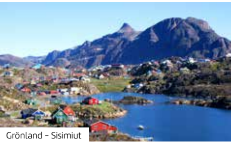
Grönland – Sisimiut

Die MS Hamburg von Plantours Kreuzfahrten zeichnet sich durch ihre Größe aus: Mit maximal 400 Gästen ist sie ein kleines, familiäres Schiff und ideal für außergewöhnliche Reiserouten für Weltbummler fernab des Massentourismus. An Bord herrscht eine persönliche, legere und herzliche Atmosphäre. Auf nur sechs Decks ist alles schnell erreichbar – sei es das Restaurant, der Lounge-Bereich oder der Sonnendeck-Pool. Die übersichtliche Bauweise ermöglicht zudem das Anlaufen kleinerer Häfen – perfekt, um Komfort und Individualität auf exklusiven Routen zu vereinen. Dank ihrer kompakten Form ist die MS Hamburg wie gemacht für außergewöhnliche Ziele im hohen Norden. Ob zerklüftete Fjorde, abgelegene Siedlungen oder gewaltige Gletscher – das Schiff bringt Sie dorthin, wo große Kreuzfahrtriesen passen müssen. Nach einer umfassenden Modernisierung überzeugt das Schiff mit geschmackvollem Ambiente und durchdachtem Design: neu gestaltete Kabinen, stilvolle Rückzugsorte, eine offene Poolbar sowie neue Genussbereiche mit maritimer Atmosphäre laden zum Verweilen ein. Deutschsprachige Betreuung, ein aufmerksamer Service und ein abwechslungsreiches Unterhaltungsangebot mit spannenden Lektorenvorträgen sorgen für entspannte Seetage. Kulinarisch verwöhnt Sie die MS Hamburg mit einer Mischung aus gehobener Küche und regional inspirierten Spezialitäten – wahlweise à la carte oder in Buffetform. Wer mag,