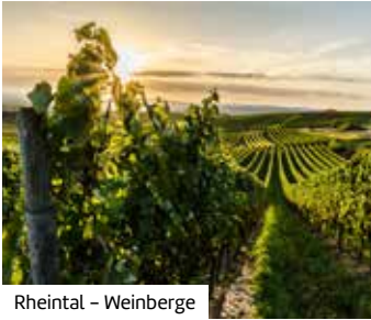
Rheintal – Weinberge