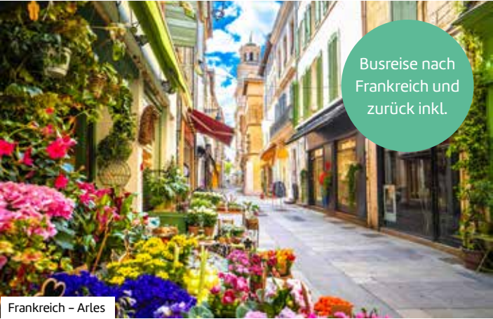
Frankreich – Arles

Buchen Sie hier diese Reise direkt: berge-meer.de/K83294