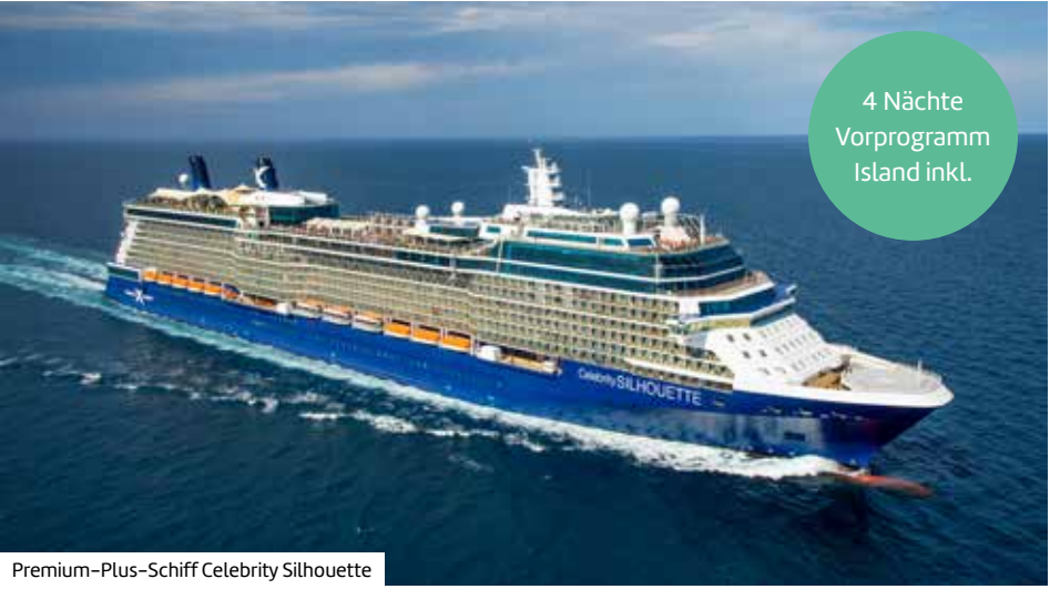
Premium-Plus-Schiff Celebrity Silhouette

Reisezeitraum Februar – Dezember 2026 Reisedauer: 13 Nächte Termine, Kabinenkategorien & Preise online. Weitere Abflughäfen (ggf. mit Zuschlag) online buchbar.