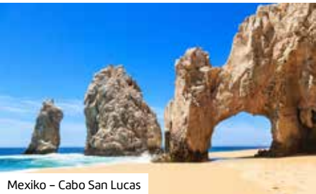
Mexiko – Cabo San Lucas