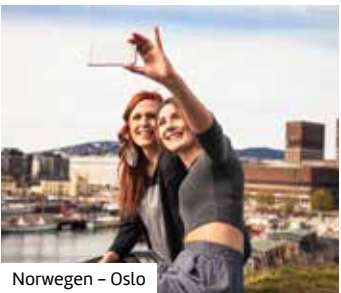
Norwegen – Oslo