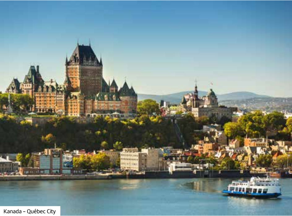
Kanada – Québec City