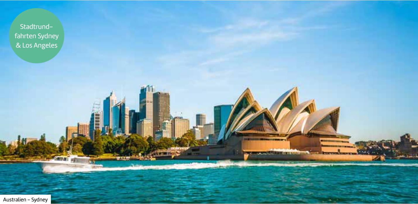
Australien – Sydney