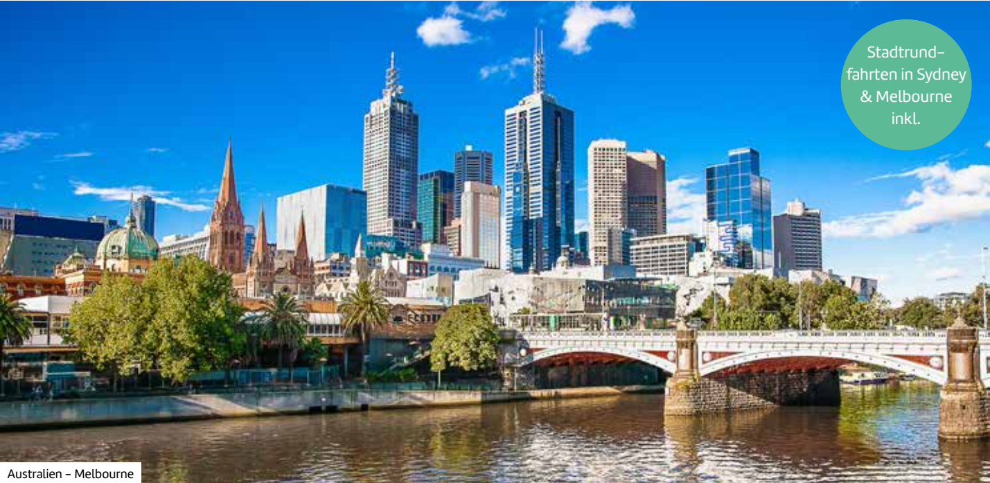
Australien – Melbourne

Stadtrund- fahrten in Sydney & Melbourne inkl.