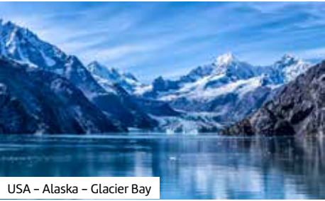
USA – Alaska – Glacier Bay