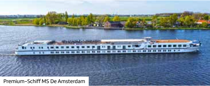
Premium-Schiff MS De Amsterdam

Buchen Sie hier diese Reise direkt: berge-meer.de/ K84131