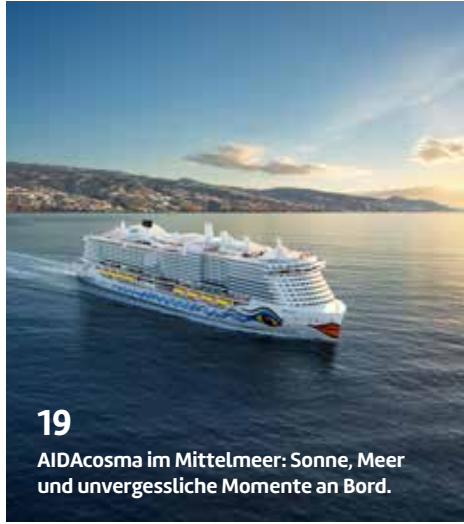
19 AIDAcosma im Mittelmeer: Sonne, Meer und unvergessliche Momente an Bord.