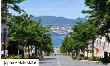
Japan – Hakodate

Eine Reise voller Kontraste erwartet Sie: von Chinas Kaiserpalästen über die Große Mauer und den Yangtze bis zu Japans faszinierenden Häfen.