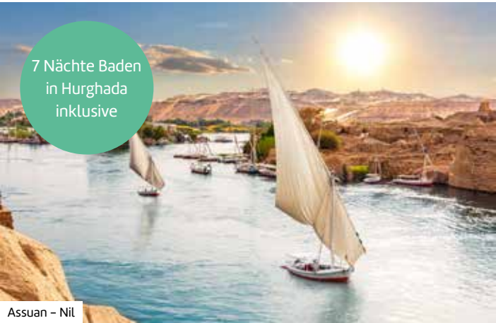
Assuan – Nil