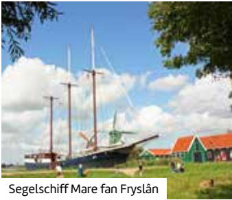
Segelschiff Mare fan Fryslân