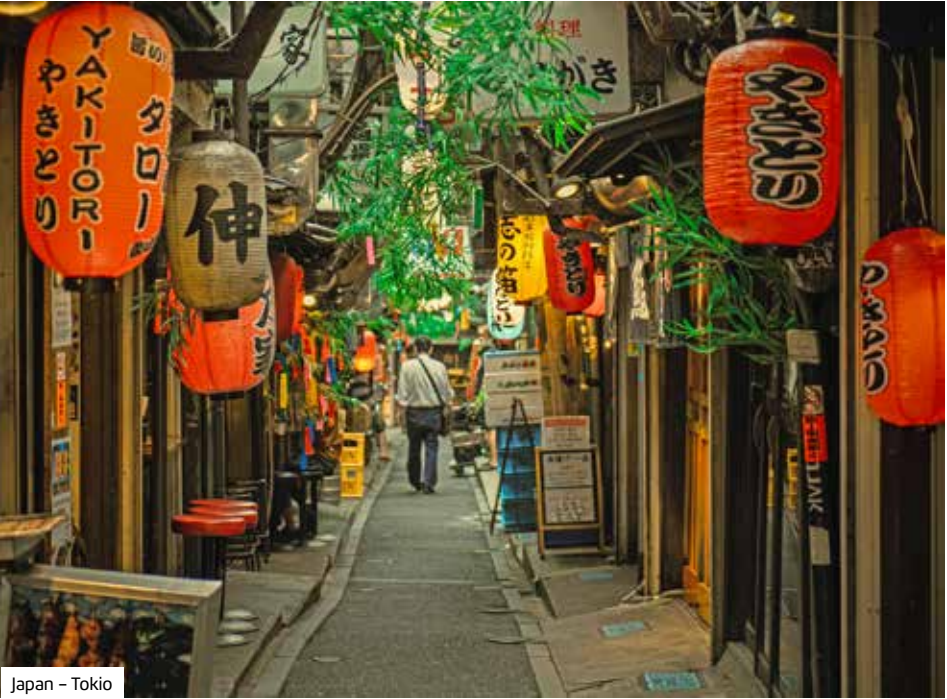
Japan – Tokio

Premium-Plus-Schiff Westerdam Ungewöhnlich viel Platz finden Sie auf der 285 m langen, aber nur 1.916 Gäste fassenden Westerdam der Holland America Line. Das 2004 in Dienst gestellte Schiff wurde jüngst renoviert und bietet nach wie vor den von der Reederei bekannten erstklassigen Service und ein gehobenes Ambiente. Auch kulinarisch kommen Sie an Bord voll auf Ihre Kosten. Sei es im Buffet-Restaurant auf dem Lidodeck, im À-la-carte-Restaurant oder im Spezialitätenrestaurant Pinnacle Grill – für jeden Gast ist etwas dabei. Tagsüber warten unter anderem zwei Swimmingpools, mehrere Whirlpools, ein Fitnesscenter, exklusive Workshops von America's Test Kitchen und die Explorations Central, ein interaktiver Bildschirm zur Vorbereitung auf das Landprogramm mit interessanten Informationen über Land, Leute und Kultur. Oder Sie lassen sich im Greenhouse SPA mit einer Massage verwöhnen. Die Innenkabinen (ca. 15 m²) verfügen über Einzelbett, Kleiderschrank, Sat.-TV, Kosmetikspiegel, Safe, Bademantel sowie Bad mit Dusche, WC, Föhn und Pflegeartikeln. Die Außenkabinen (ca. 16 m²)