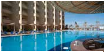
4-Sterne-Hotel AMC Royal Hotel & SPA