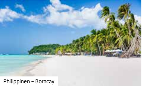
Philippinen – Boracay