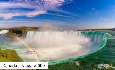
Kanada – Niagarafälle