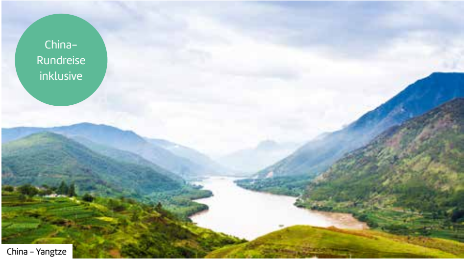
China – Yangtze