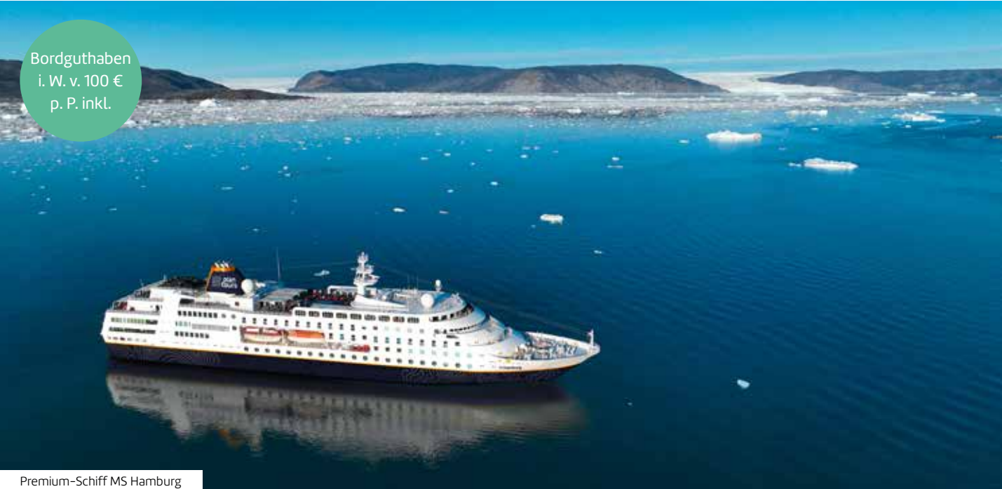
Premium-Schiff MS Hamburg