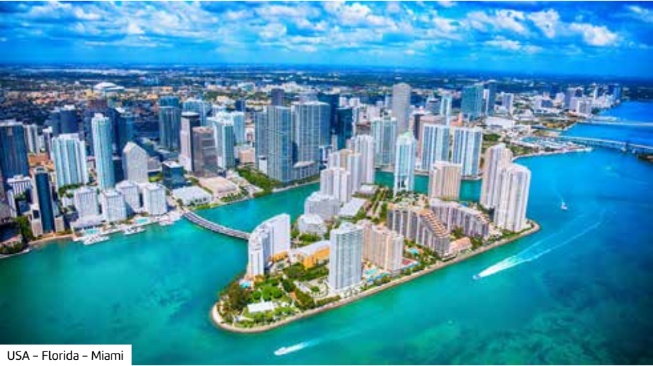
USA – Florida – Miami