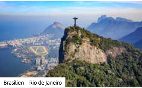
Brasilien – Rio de Janeiro