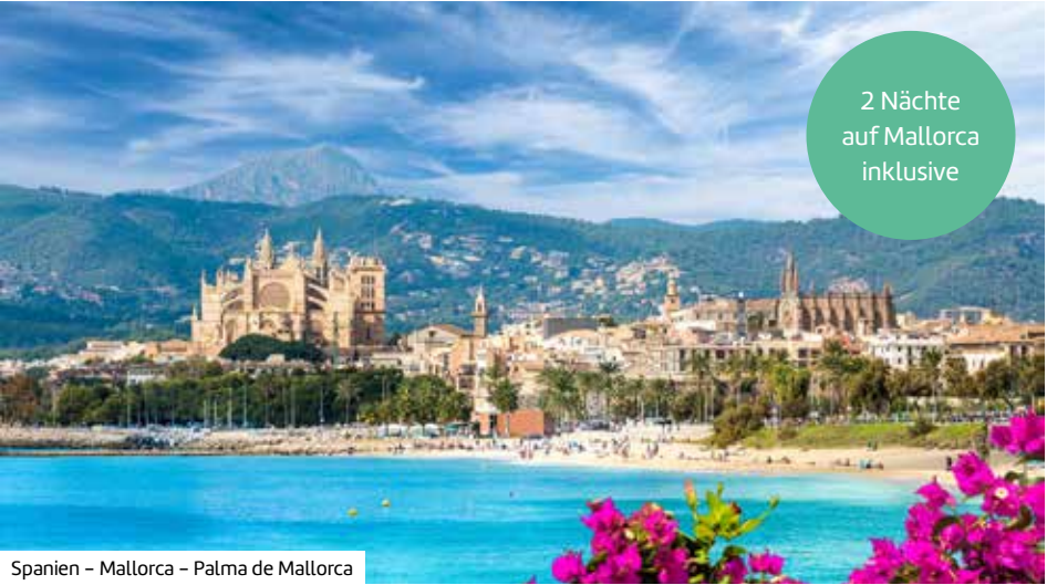
Spanien – Mallorca – Palma de Mallorca