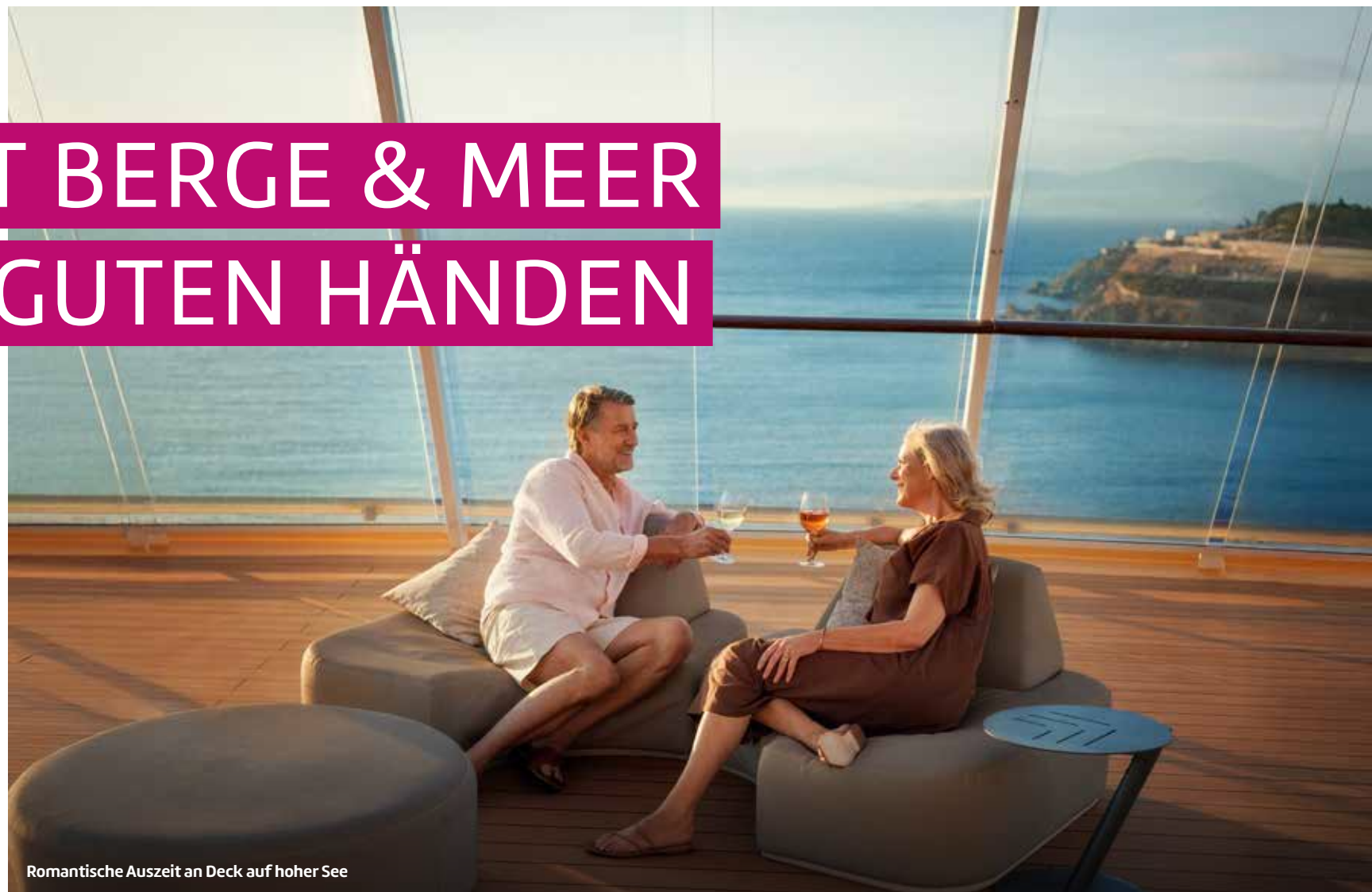
Romantische Auszeit an Deck auf hoher See