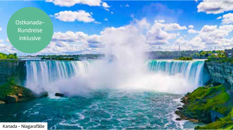
Kanada – Niagarafälle