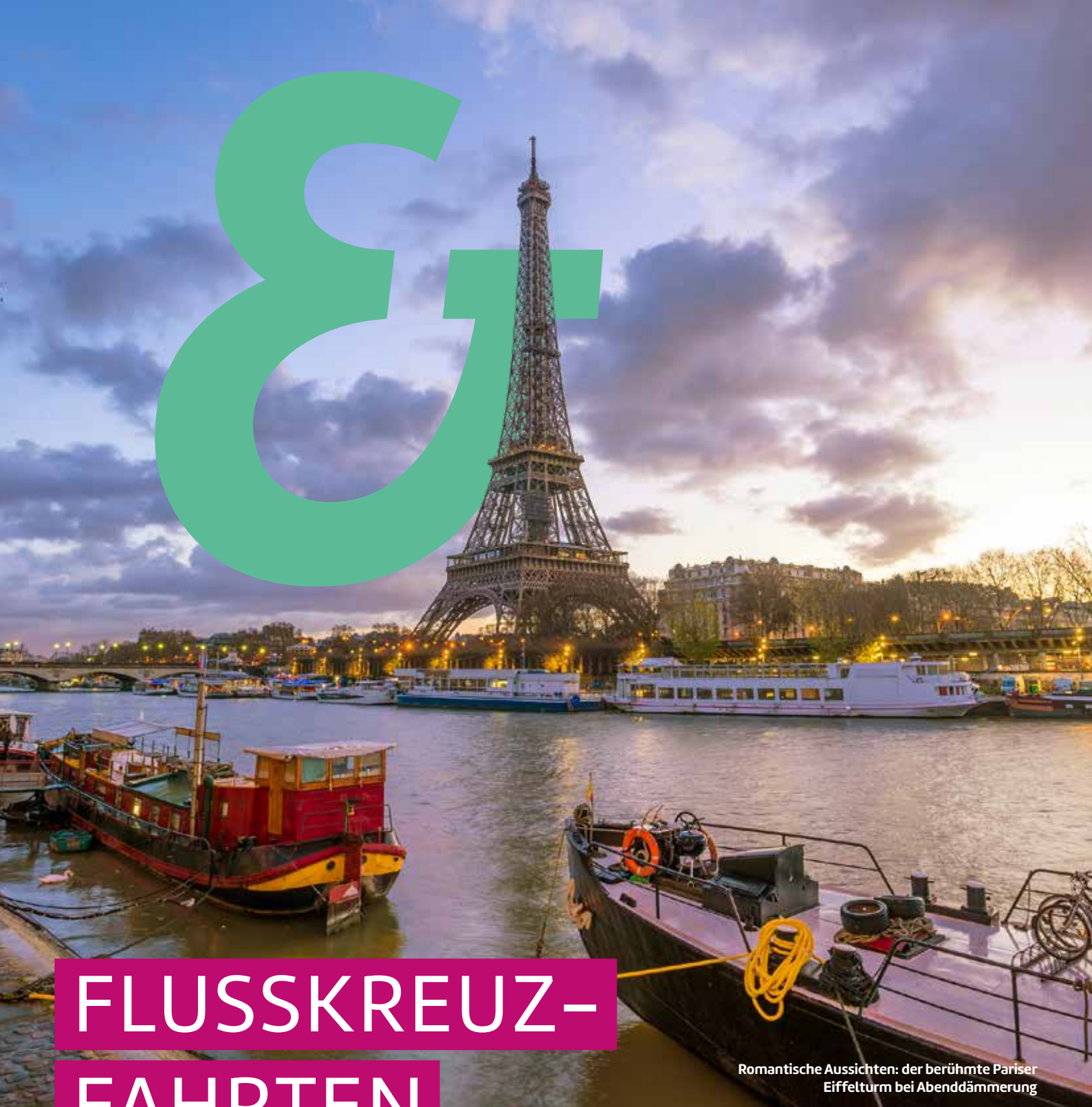
Romantische Aussichten: der berühmte Pariser Eiffelturm bei Abenddämmerung