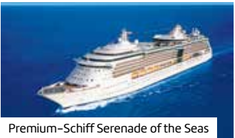
Premium-Schiff Serenade of the Seas