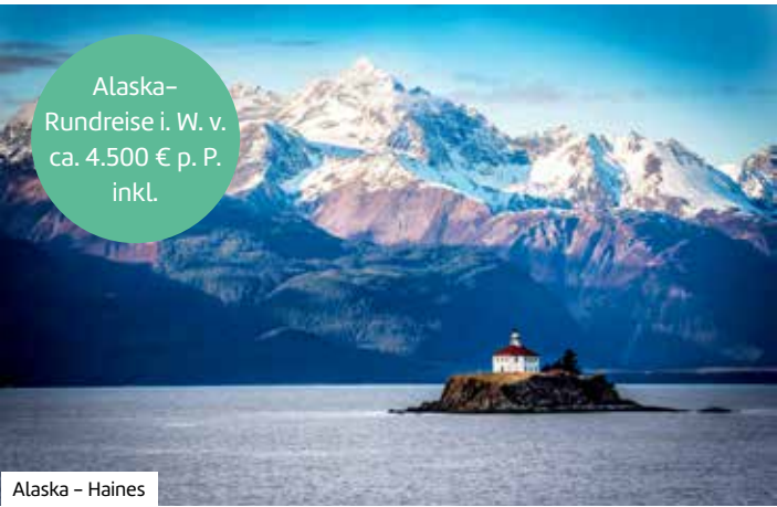
Alaska- Rundreise i. W. v. ca. 4.500 € p. P. inkl.

Buchen Sie hier diese Reise direkt: berge-meer.de/ K8U318