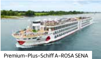
Premium-Plus-Schiff A-ROSA SENA