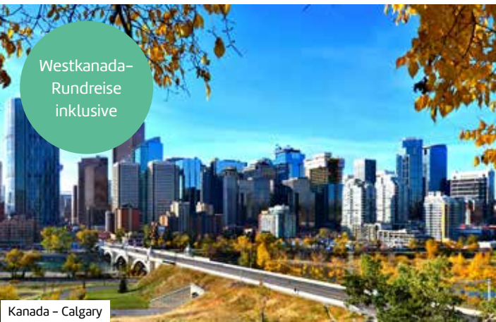
Westkanada- Rundreise inklusive