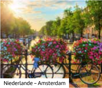
Niederlande – Amsterdam